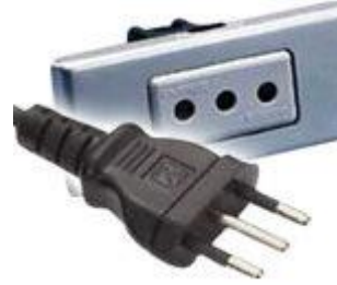
Tipo L: Válido para clavijas C