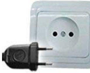
Tipo C: Válido para clavijas E y F